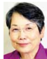
伊藤えつ子 市議会議員