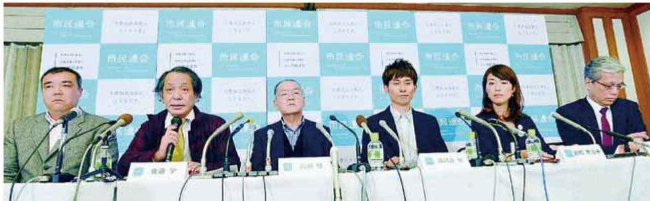
12月20日、「安保法制の廃止と立憲主義の回復を求める市民連合」（略称＝市民連合）を結成、記者会見