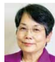
伊藤えつ子 市議会議員