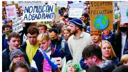
気候危機打開を求め若者2.5万人がデモ(英)

気候危機打開に向け行動する若者の団体「未来のための金曜日(FFF)」は市内のデモ行進を主催。約25,000人が、抜本的な地球温暖化対策の強化を求めました。日本の高校生・大学生も列に加わりました。男性(21歳)は「熱気がすごくて元気づけられた。こんなに大勢の人が行動していると、日本に帰ったら伝えたい」と話しました。