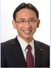
塩川鉄也衆議院議員

北関東 4 県で前回総選挙と同様の約 44 万票をいただき、北関東比例ブロックで現有の 1 議席を確保しました。引き続き国会で公約実現のためにまた、野党共闘の前進と日本共産党を強く大きくするために全力を挙げる決意です。