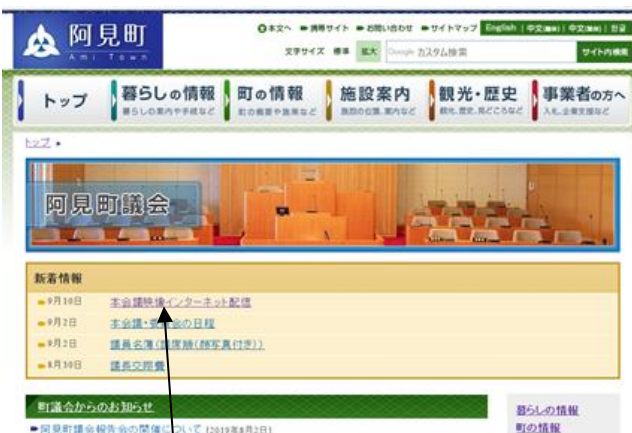
議会 HP ここをクリック