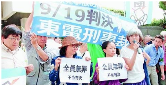
東京地裁前での集会

市民は「これだけのことをやってもだれも責任を取らないのか」「司法は死んだ」と訴えました。