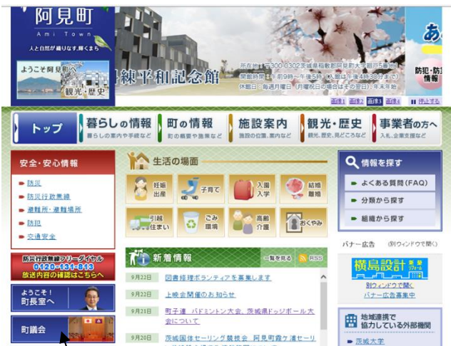
阿見町の HP のここをクリック

阿見町のホームページから議会を開き、本会議インターネット配信をクリックすると、YouTube の動画サイト(別ウィンドウで開く)が出ますので、そこをクリックしてください。