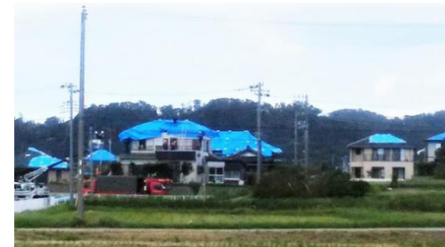
ブルーシートのかかる家々